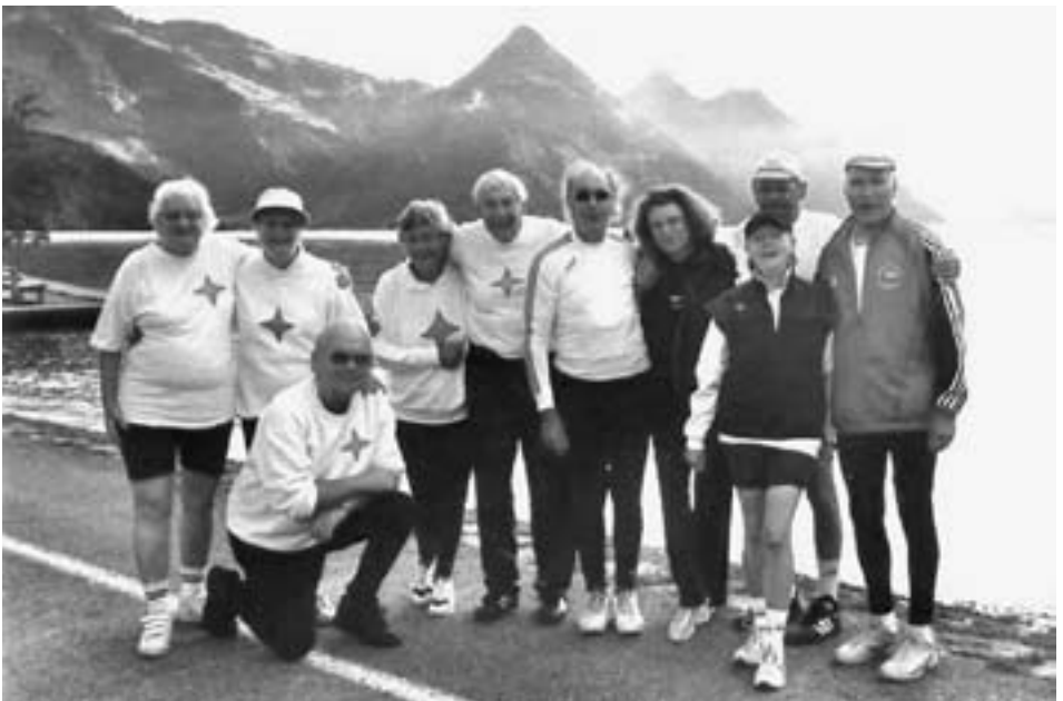
Die Erlebnishungrigen vor beeindruckender Landschaft

Um 9.30 Uhr, nach gutem Frühstück, Abfahrt! Wieder schönes Wetter? Denkste! Auf dem Weg nach Brunnen und Treib (Richtung Urnersee) zieht alles zu. Das Theater ist schnell komplett. Doch bei 24 Grad ist der Truppe der Spaß nicht zu nehmen. Geisterhaft gleiten die fast leeren Schiffe an uns vorbei. Bunte Schirme recken sich in den Himmel. Ohne viel Erfolg! Alle sind schon bald völlig durchnässt – aber lustig und zu jeder Schandtat bereit. Es ist kein Regen mehr! Das Nass stürzt wie aus Kübeln auf uns hernieder. Die Schöpfkelle muß in Aktion treten. Am bekannten Bagger vorbei – nur lachende Gesichter und dumme Sprüche. Das sind die Barke-noldies! Mit zunehmender Dunkelheit kommt Sturm auf, und der Wellengang wird stärker. Die Warnleuchten rund um den See zeigen akuten Alarm (90 Blitze in der