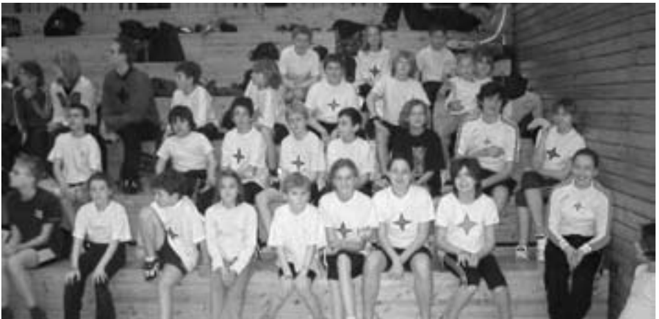
Teilnehmer und Teilnehmerinnen der Kindertalentiade

Wie bereits in den letzten Jahren sollten die Regatten in Waltrop und Kettwig dazu dienen, die Chancen der einzelnen Bootsgattungen beim Landeswettbewerb zu testen und den Jüngeren die ersten Regatta- bzw. Slalomstarts zu ermöglichen.