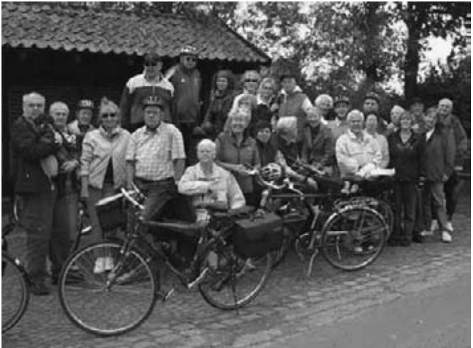
Frühstück in der Dorfbauernschaft Frerich

Wettertechnisch war alles im grünen Bereich. Bis jetzt. Eine halbe Stunde nach der Mittagspause hat es nicht geregnet, es hat geschüttet. Jeder suchte (vergeblich) Schutz, wo er gerade war.