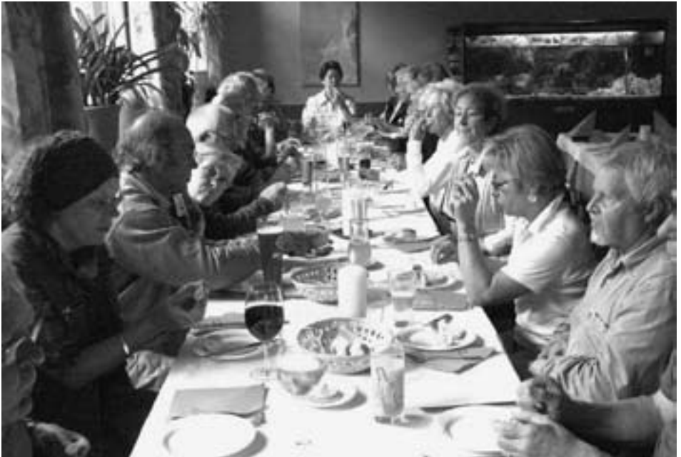
Beim Italiener in Senden

Aber wie das so ist. Im Nachhinein fanden es alle „gar nicht so schlimm“. Einziger Schaden: Niemand wollte den Abschluss in der Eisdielen wahrnehmen, „so, wie wir aussehen“.