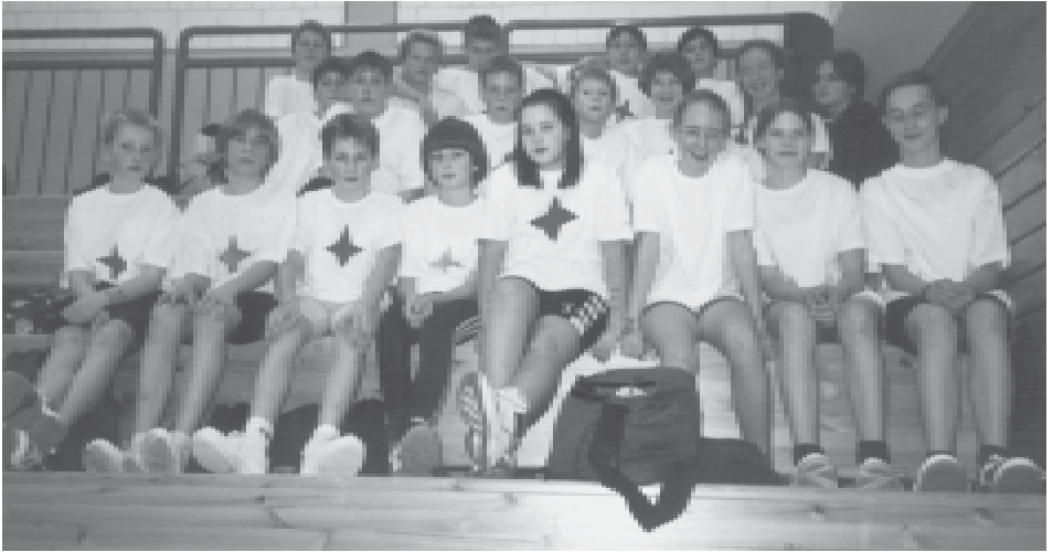
Das RCW Team bei der Talentiade