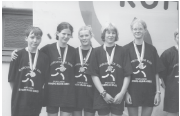
Die Silbermedaillengewinner im Juniorinnen B Doppelvierer