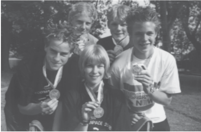
Die Goldmedaillengewinner im Junioren B Doppelvierer