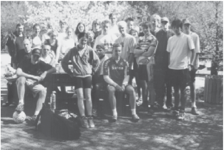
Die Teilnehmer am Ostertrainingslager