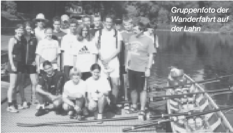
Gruppenfoto der Wanderfahrt auf der Lahn