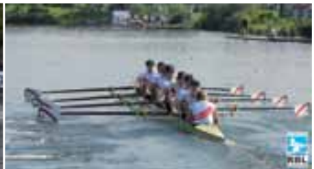
Foto rechts o.: RCW-Achter auf dem Elfrather See bei Krefeld