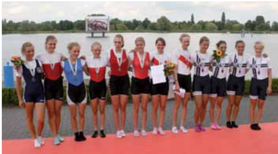
Das Siegerboot (links oben) – Platzierungen (rechts oben) – Strahlende Sieger (unten)