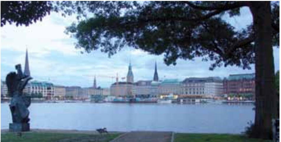
Binnenalster mit Jungfernstieg im Hintergrund

Kanäle und Fleete, eine eigene, für uns fremde Welt. Kein Garten ohne eigenen Bootsliegeplatz, kein zum Wohnhaus umgewidmeter Industriebau ohne an der Außenwand hängende Paddelboote oder Kanus. Am späten Nachmittag kehrten wir zur Rudergesellschaft zurück, um von dort Quartier beim Hotel Atlantik zu beziehen. Zumindest mit Blick auf das Hotel Atlantik, dessen Zylinderhut tragender, weiß behandschuhter Portier, den Gästen das Taxi heranwinkte, den Piccolo beauftragte, Gepäck und Wagen zu versorgen, und immer ein freundliches Gesicht zeigte. Zimmer für uns waren im Hotel IBIS gebucht, nicht ganz so vornehm, aber gut. Nach Duschen und Nachmittagsnickerchen war Stadtgang mit Abendessen angesagt. Keine Platzreservierung, kein Essen ..., geschweige denn ein gepflegtes Bier. Durch die Großstadtstraßen umher irrend, auch Empfehlungen von Einheimischen halfen nichts, fanden wir dann doch noch ein in gemütlich weißes Neonlicht getauchtes Kettenrestaurant mit noch freien Stehtischen, für die es aber Hochsitze gab. Das Essen, Pasta in vielen Variationen, Salate und eine Spitzen-Tomatensuppe, war hervorragend. Ein großes Lob dem Koch!