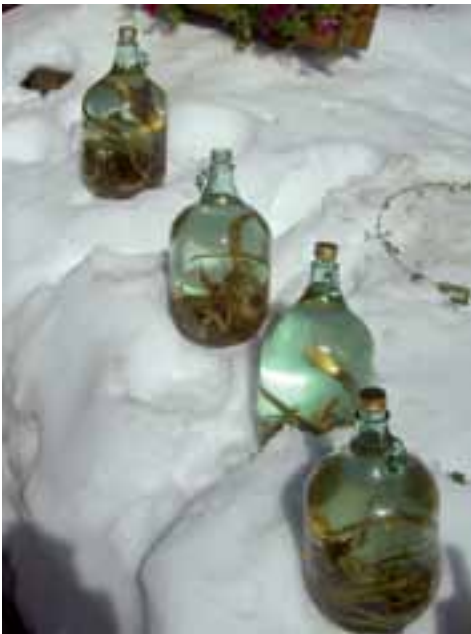
Energiesparende Kühlung beim Hüttenwirt

Für den kommenden Tag hatte sich „UNSER ETZEL“ ein tolles Programm einfallen lassen. Der Wettergott hatte nur die Farbe blau in seinem Farbkasten. Eben wie es sich gehört, wenn Gäste kommen. Immer wieder erwähnt der Chef: „Ihr seid nicht zum Vergnügen da!“ Zunächst mal gut frühstücken. Dann ab zum Kulturprogramm: Kirchenbesichtigung! Denkste! Tür zu – Öffnung erst in einer Stunde. Also nächster Termin in Meran! Noch geheim! Dann die Überraschung, Besichtigungstermin: MERANO 2000; ein Freund und Paragleit-Kollege, seit 19 Jahren dort Direktor, zeigt uns die gesamte Anlage und erläutert diese bis ins letzte Detail. Anschließend geht es mit der 120 Personen fassenden Gondel auf 2000 Meter hinauf. Ungewöhnlich und neu ist nach der Neuerrichtung im Jahre 2010 ein mit großer Technik angereicherter Zwischeneinstieg für Wanderer. Oben angekommen, werden uns die Antriebsmaschine und die Notrettung erklärt.