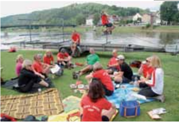
Lustig ist das Zigeunerleben... (aber bitte mit Hightech zum Kaffeekochen)