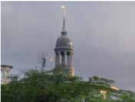
Der Hamburger Michel