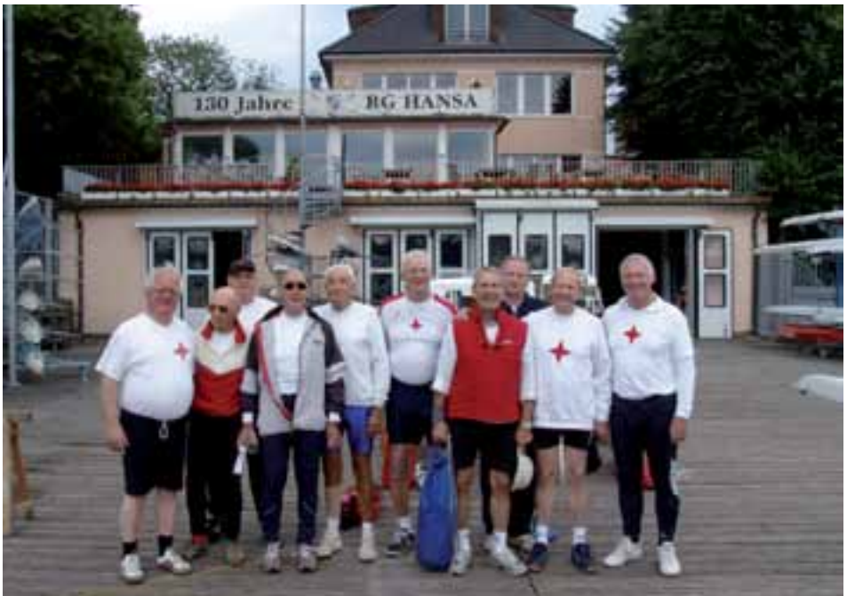
Alte Herren auf dem Steg der Hamburger RG HANSA