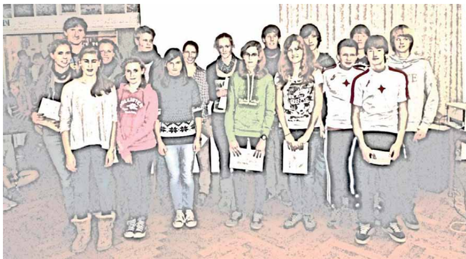
Fast alle Ergocupsieger

Neben den Trainingsruderern der Senioren, Junioren und den Kinderruderern wagten sich auch in diesem Jahr wieder die Eltern der jüngsten Ruderer beim Mütter- bzw. Väter-Cup auf die Ergometer. Wie in allen Altersklassen gab es auch hier viele spannende Rennen, die per Beamer auf die Wand projiziert wurden, so dass das große Publikum den Rennverlauf genau verfolgen konnte.