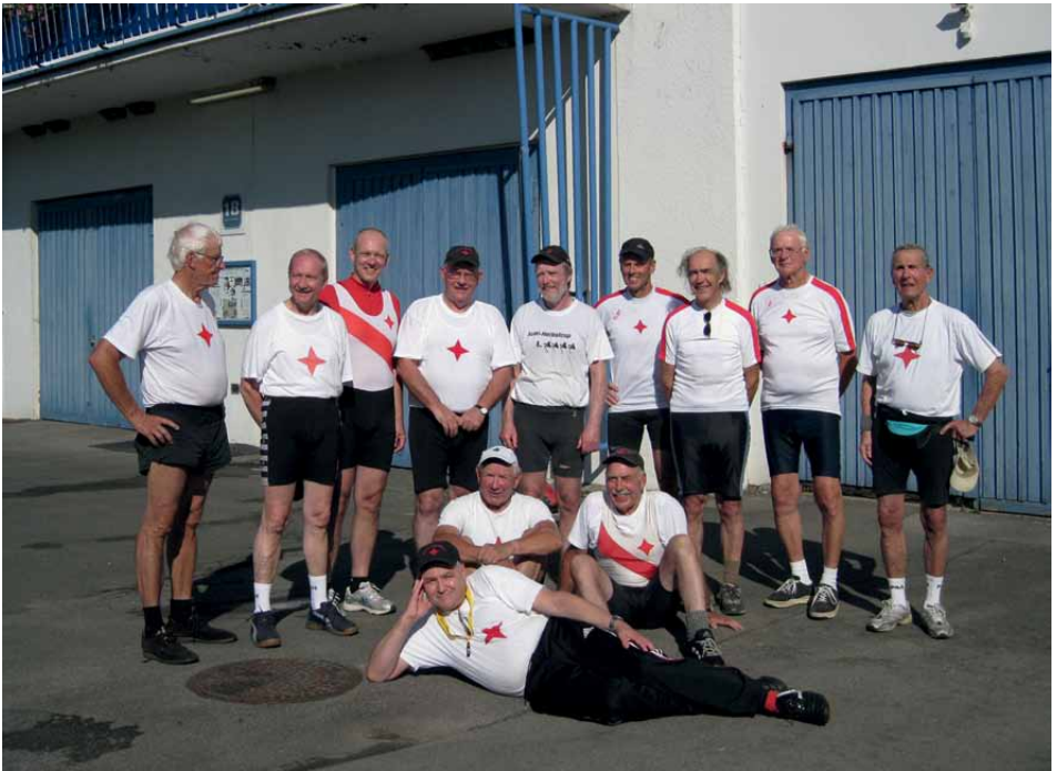
Am Ruderverein Höxter von 1896