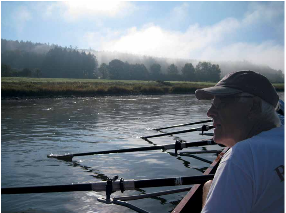
Die Ruder halt und Blätter ab!

Erster Abschnitt: vom RV Hann.-Münden bis Kloster Bursfelde, nach einer ewig langen Wartezeit an der Schleuse in Hann.-Münden, Mittagsrast. Dann der zweite Tagesabschnitt, nicht wie geplant zur Fähre nach Lippoldsberg, sondern wegen des Niedrigwassers 1,4 km weiter an den Steg von Bodenfelde. Die Boote haben wir auf der Wiese gelagert und uns auf den Abend im Lippoldsberger Hof gefreut. Der Wirt war auch schon wieder munter und das vorbestellte Essen wie immer gut-bürgerlich, wie man so sagt. Der für alle dann erste gemeinsame Abend wurde feucht-fröhlich, während der Autor dieser Zeilen durch die Nacht nach Hause jagte, um pünktlich am nächsten Morgen unsere Ruderinnen und Ruderer bei den Landesmeisterschaften in Duisburg-Wedau anzufeuern und zu filmen.