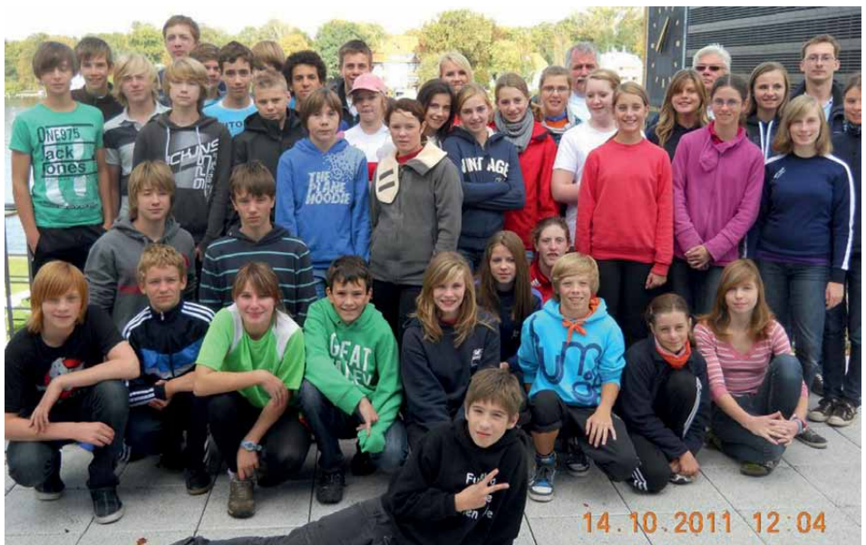
Unsere künftigen Meister