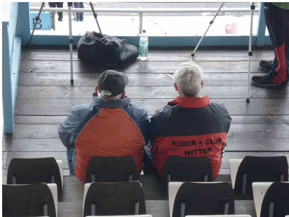
Kritische Beobachter bei Bundeswettbewerb München 2011

Das Kinderrudern stellt derzeit den wesentlichen Quell aller weiteren Rekrutierung