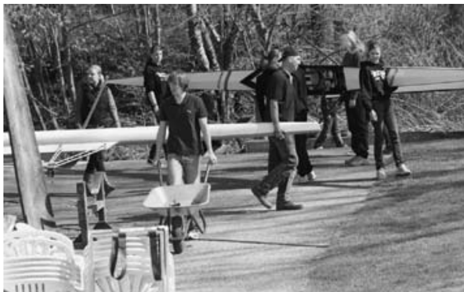
RCW – Generalreinigung