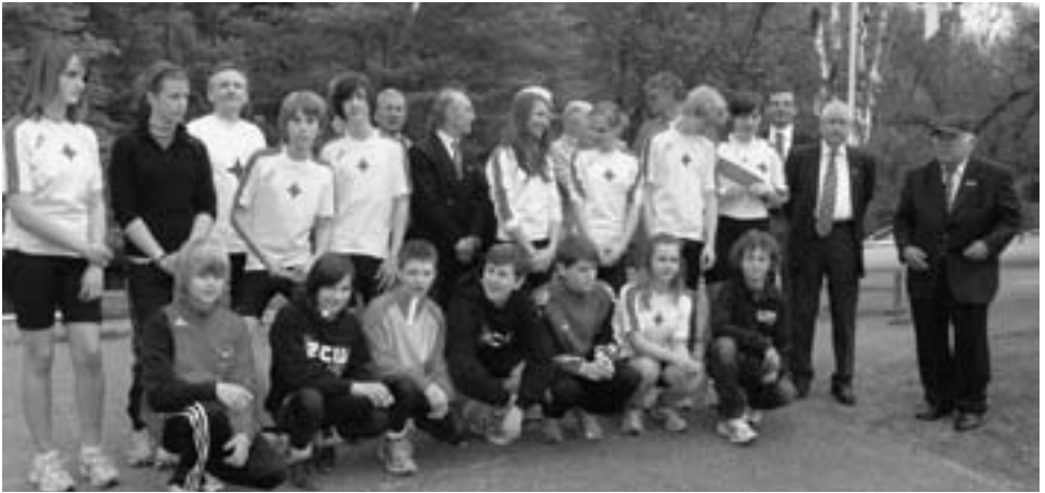
Alle Ausgezeichneten, die die Bedingungen des DRV für den Fahrtenwettbewerb erfüllt hatten