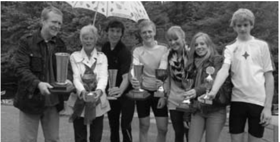
Die Gewinner eines Pokals