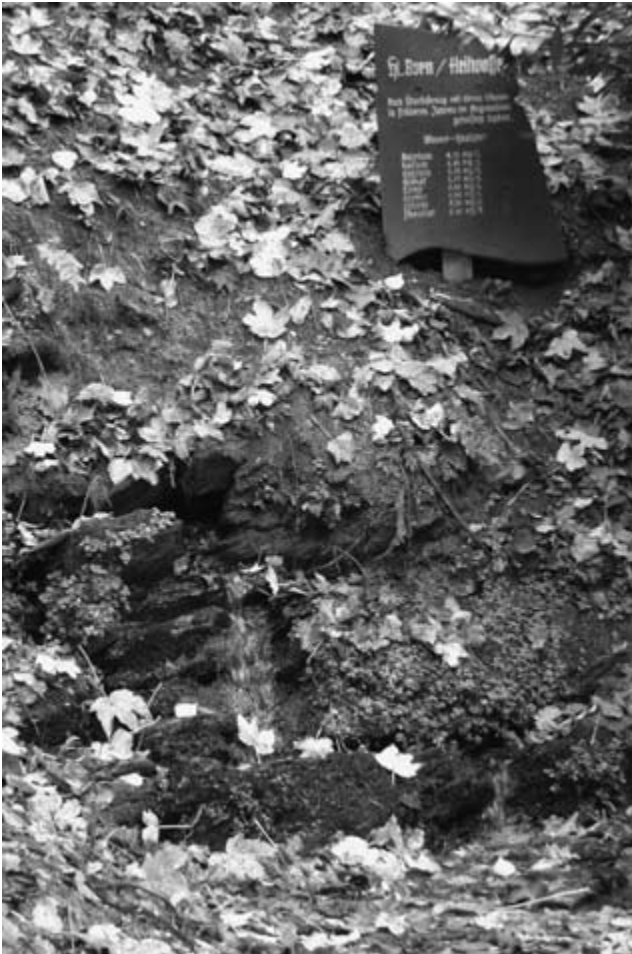
Bei diesem Rinnsal ist genaues Hinsehen gefragt

umgestellt auf Regen. Egal gewandert wird trotzdem. Ja, aber bitte keine Berge die man später wieder runterlaufen muß. Gut, fahren wir zu dem Ort Saalhausen. Dort können wir einen Rundweg an der Lenne entlang unter die Füße nehmen. Laut Karte ist dort ein Parkplatz und die Wanderung kann da beginnen. Den Parkplatz haben wir gefunden und, man ahnt es schon, wieder keine Wanderzeichen. Drei nimmermüde hatten sich gefunden die gerne noch einen Berg erobern wollten. Na, bitte schön. So trennten sich die Wanderer. Als Treffpunkt zum Mittag wurde die „Dorfschänke“ ausgemacht. Während also die einen Berg rauf und wieder runter liefen gingen die anderen gemächlich Spazieren und genossen unterwegs einen guten Cappuccino.