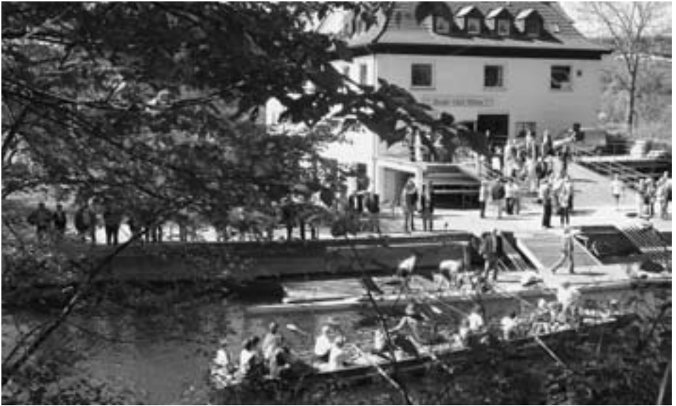
Die Fahrt mit der Barke wird von unsere kleinen Gäste gerne wahrgenommen und stand unter der bewährten Leitung von Helmut Grabow

Kinder am Ruderclub ein Trainingslager mit Übernachtung und Grillen durchgeführt hatten.