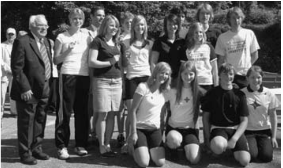
Die Jugendlichen, die das Fahrtenabzeichen erhielten und....