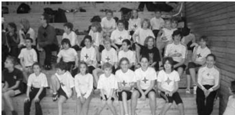
Teilnehmer und Teilnehmerinnen der Kindertalentiade

Wie bereits in den letzten Jahren sollten die Regatten in Waltrop und Kettwig dazu dienen, die Chancen der einzelnen Bootsgattungen beim Landeswettbewerb zu testen und den Jüngeren die ersten Regatta- bzw. Slalomstarts zu ermöglichen.